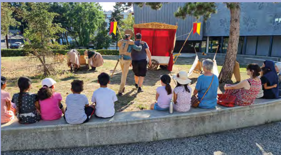
26 juillet 2022 : théâtre sur l'esplanade