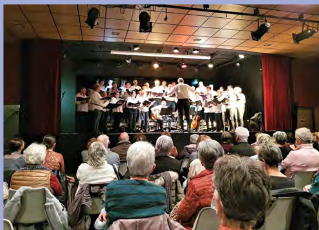
La chorale de Taulhac se produit à Guitard le 1 er avril 2022. Un bel ensemble pour une belle prestation