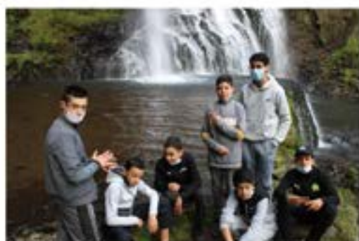
Les cascades de la Baume