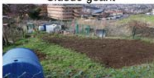
Préparation du jardin

Si toi aussi tu souhaites faire partie de l'équipe du « Quoi t'as dit jeunesse », que tu veux partager une passion, un savoir faire, n'hésite pas à venir nous voir au relais.