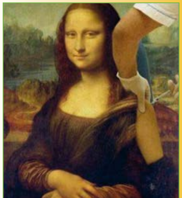
Pensez à vous faire vacciner ! (Mona Lisa)