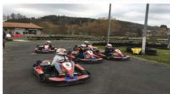
Karting de Saint Paulien